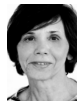
di Lucia Siliprandi